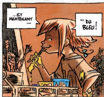
Petite souris, Grosse bêtise - Dauvillier et Kokor (éd. de la Gouttière)