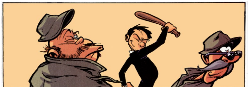
Spirou et Fantasio – Morvan et Munuera (éd. Dupuis)