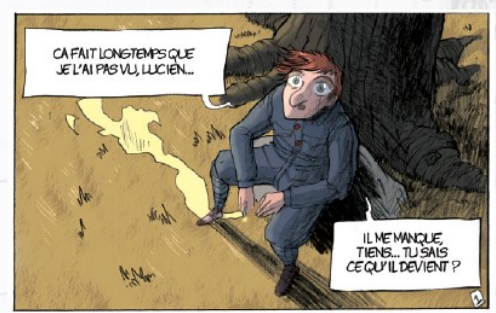
Cicatrices de guerre(s) - Hautière et Drouin (éd. de la Gouttière)