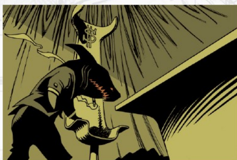
La Carotte aux étoiles - Riff et Lejonc (éd. de la Gouttière)

Retrouve et nomme le plan et le type de visée choisis dans chacune de ces images