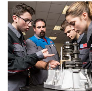
Bienveillance et rigueur, l'esprit GARAC